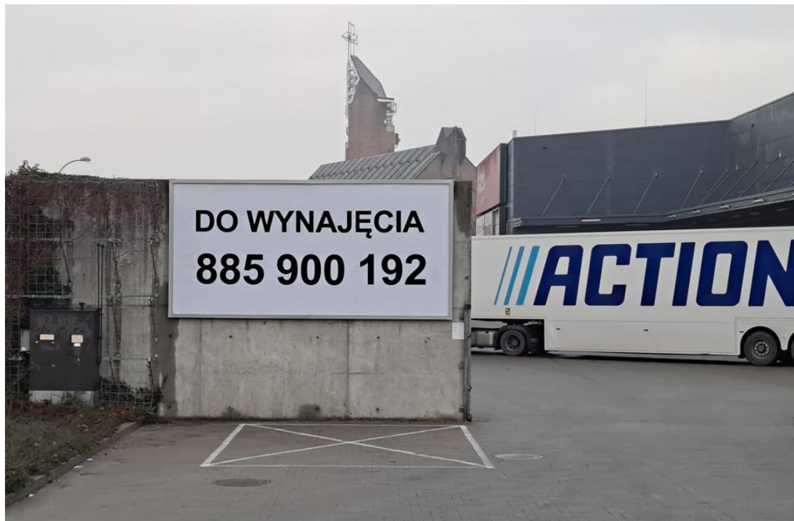
Tablica 2 Cena: 700 PLN netto /miesiąc

Strefa przy stacji Orlen i Orliku ul. Katyńska