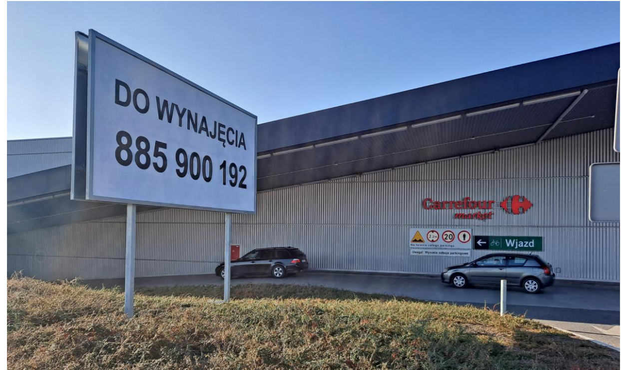
Tablica 1B Cena: 1000 PLN netto/miesiąc