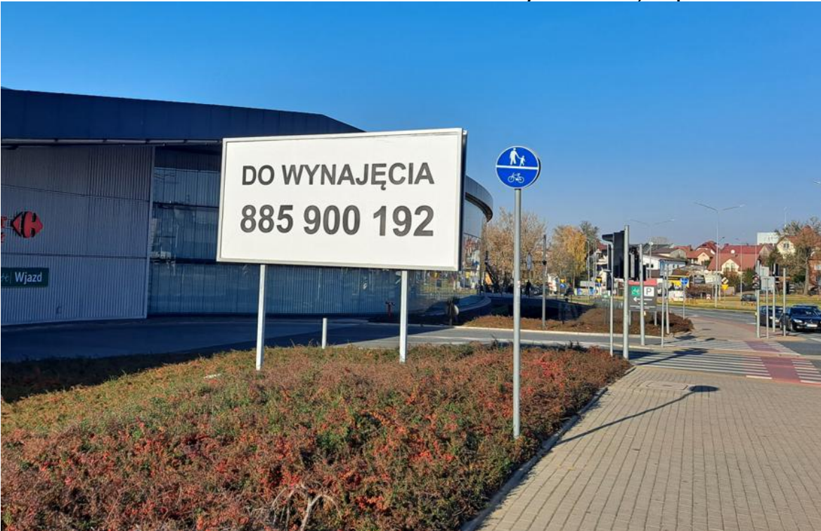
Tablica 1A Cena: 1000 PLN netto/miesiąc