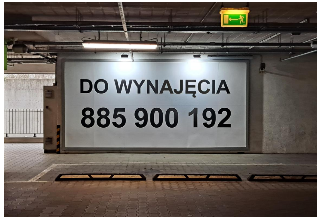
Tablica 3 Cena: 700 PLN netto/miesiąc